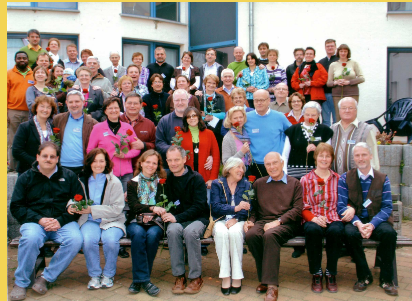
25 Paare nach der Erneuerung des Eheversprechens am Ende des Ehepaar-Seminars 2010