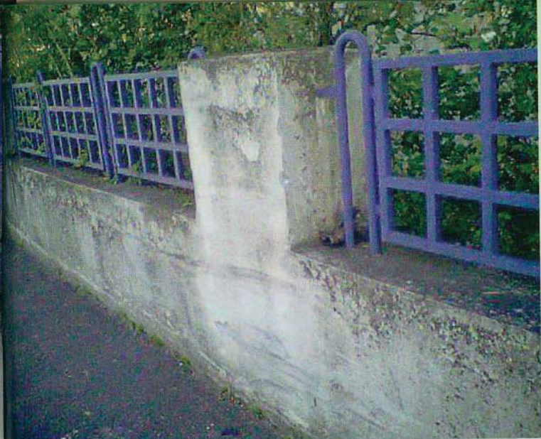
Mehr als nur eine Mauer: der Unfallort